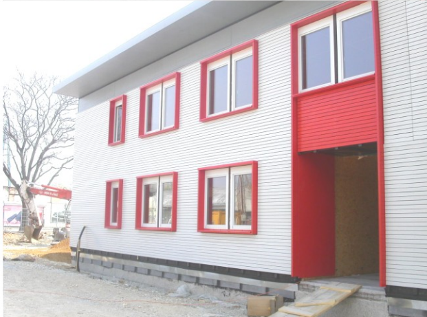
U2-6 kurz vor Fertigstellung nach der geplanten Nutzungsdauer von 6-8 Jahren werden die Gebäuden an anderer Stelle wiederverwendet (ebenso U2-6, U2-8, U2-10)