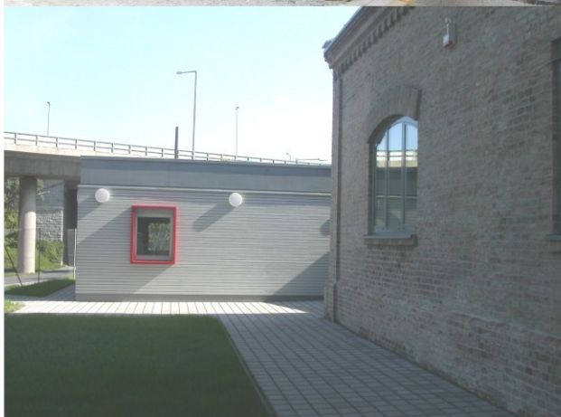
U2-7 Sanierung und Umbau des ehemaligen Pumpenhaus Aussenraum