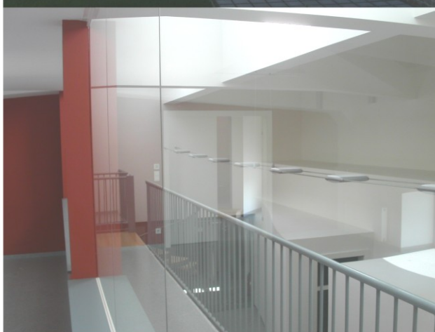
U2-7 Sanierung und Umbau des ehemaligen Pumpenhaus Innenraum