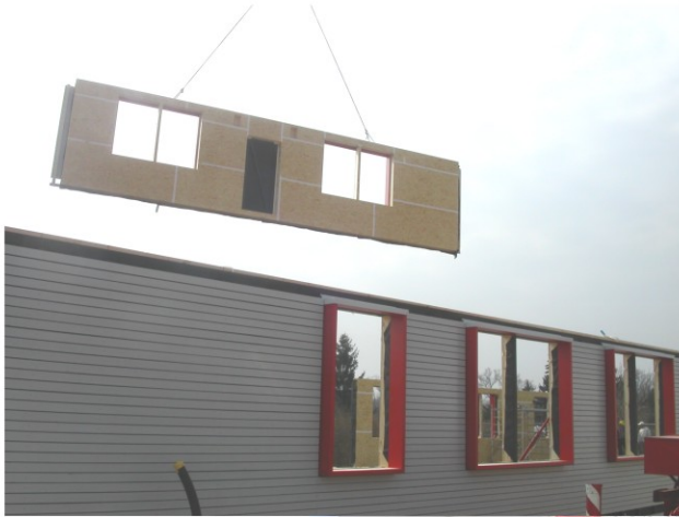
U2-6 Montage der Fertigteile großformatige Wandelemente Deckenelemente Dachelemente sind vorgefertigt. Innerhalb einiger Tage ist der Rohbau errichtet. (ebenso U2-6, U2-8, U2-10)